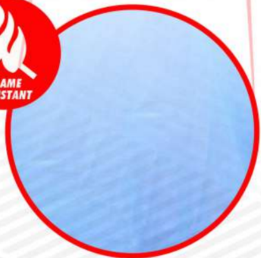
Tela resistente al fuego Fyrban FRC