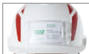
Tiras adhesivas y soporte de distintivos opcionales