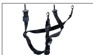
Barboqueo de 4 puntos