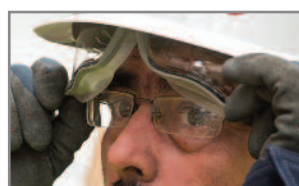
El área de agarre facilita el repliegue del visor