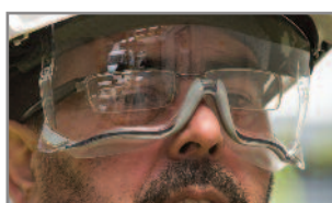
Junta de goma exclusiva para garantizar una protección ocular sin resquicios