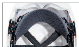
Sudadera reemplazable de primera calidad