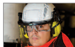
Ranuras estándar para acoplar orejeras o pantalla exterior