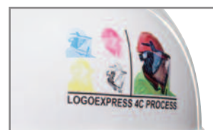
Impresión a color de primera calidad